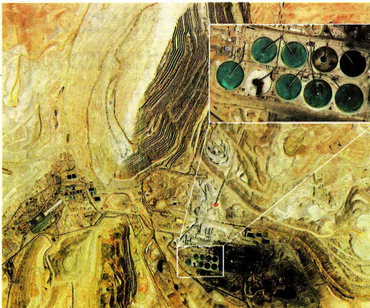
►► Unas de las primeras imágenes tomadas por el satélite Fasat-Charlie fueron de Chuquicamata.